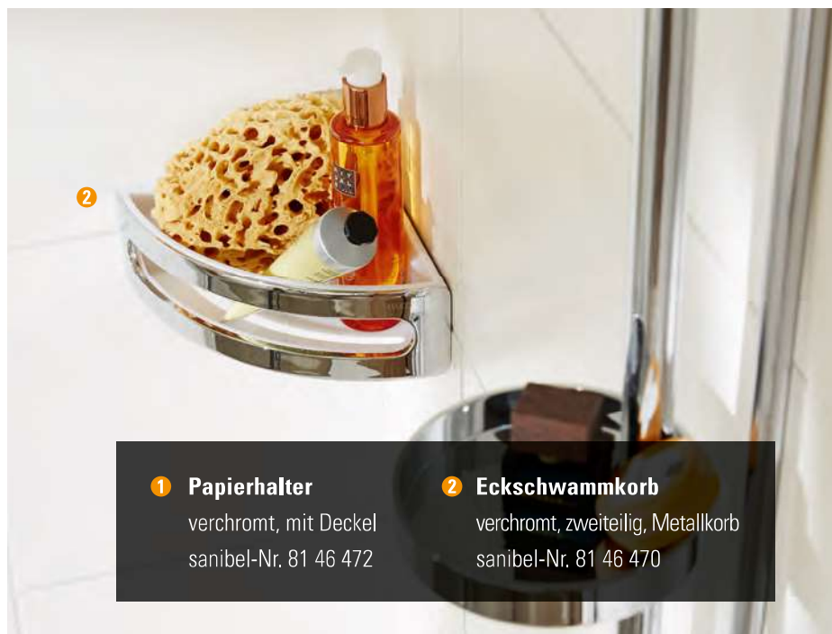
2 Eckschwammkorb verchromt, zweiteilig, Metallkorb sanibel-Nr. 81 46 470