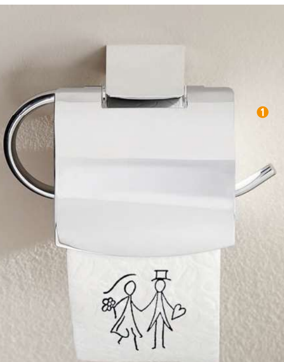
1 Papierhalter verchromt, mit Deckel sanibel-Nr. 81 46 472

verchromt, mit Halterung, 250 mm breit sanibel-Nr. 81 46 479